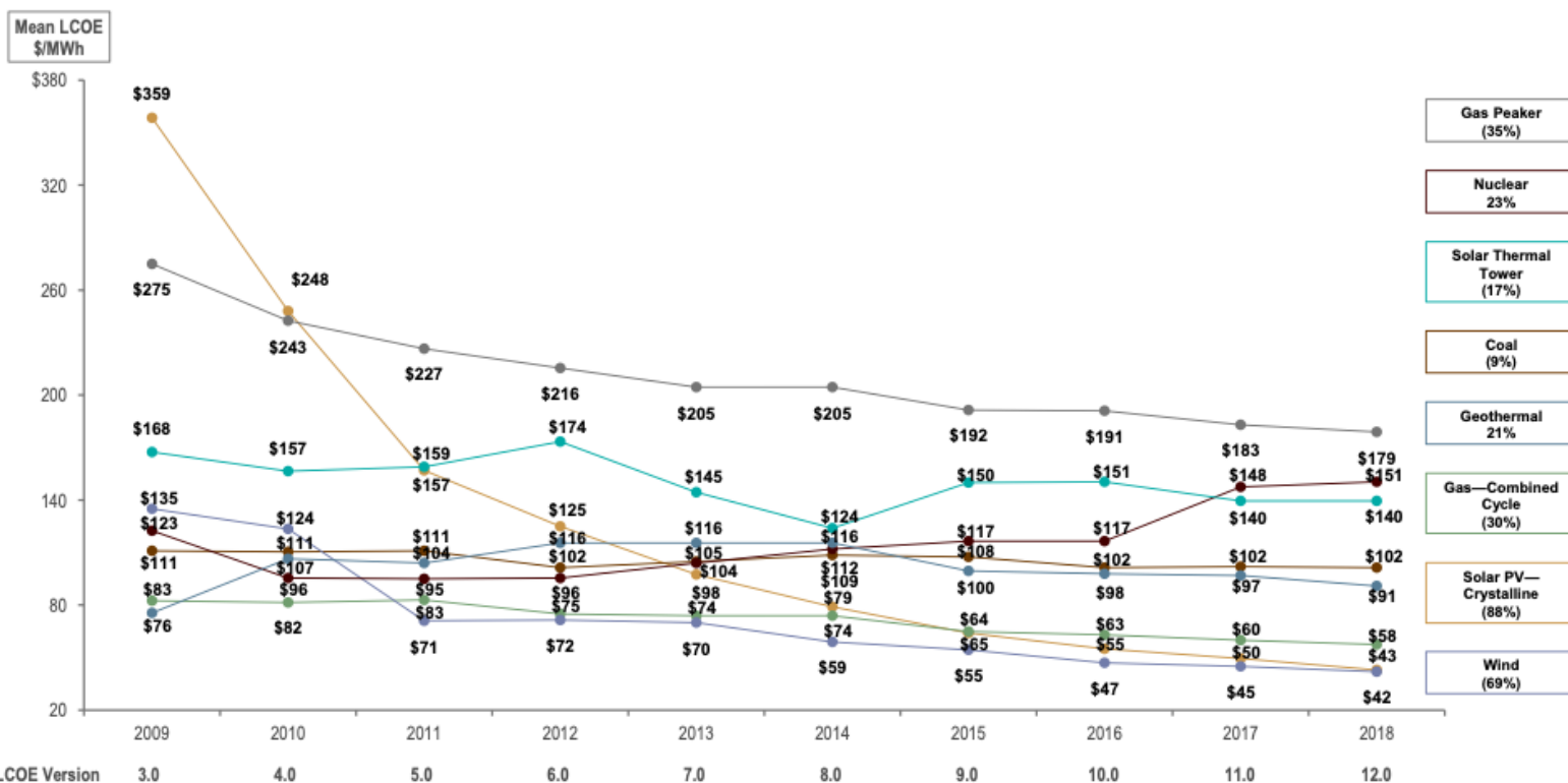
FIGUR 3: Gjennomsnittlig energikostnad for ulike energislag ifølge Lazard. 17

Et norsk rammeverk for havvind bør ha som ambisjon å bli subsidiefri og å utvikle en konkurransedyktig norsk industri innen flytende havvind. Målet bør være at norsk flytende havvind blir først ute med å presse kostnadene ned til et nivå der teknologien ikke lenger krever subsidier. Dermed blir subsidier for flytende vindkraft i Norge investeringer i en framtidig konkurransedyktig industri. Rammeverket må derfor inneholde mekanismer som stimulerer industriutvikling i Norge.